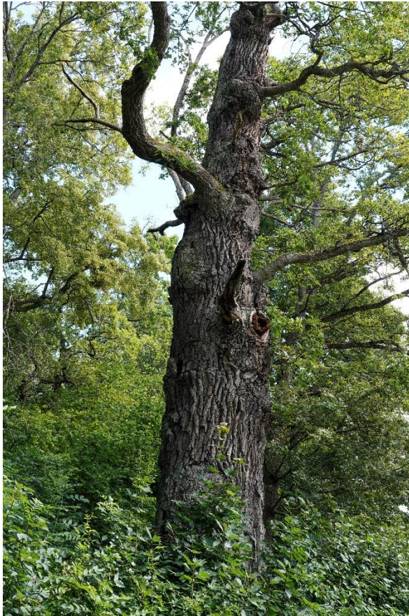
Figur 1. Nedanför områdets blockiga terräng växer grova ekar.

Det föreslagna biotopskyddsområdet är indelat i två delområden. Det östra området utgörs av mycket varierad skog som gradvis från norr till söder övergår från gamla och grova barrträd av tall och gran till lövskog med ek, skogslind, asp, lönn och björk. Ett påtagligt inslag av flerstammig skogslind visar på lång kontinuitet av trädslaget. Grova ekar står längs gångvägen nedanför branten på västra sida av området. Hasselbuketter med stora socklar växer spridda i hela området. Det västra området är lövdominerat och i brynzonerna finns gott om grova, gamla ekar. De grova ädellövträden utgör livsmiljö för ett flertal rödlistade arter som oxtungsvamp (NT, nära hotad) och skeppsvarsfluga (NT). Även mindre hackspett (NT) trivs i området.