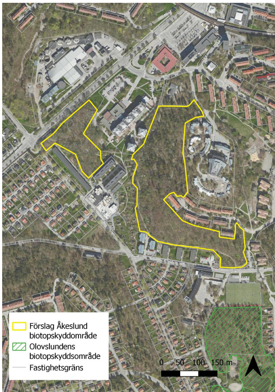
Figur 4. Översikt över föreslaget biotopskyddsområde i Åkeslund samt angränsande befintligt biotopskyddsområde i Olovslund.